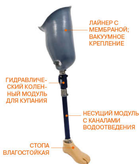
ПРОТЕЗ МОДУЛЬНЫЙ В КОСМЕТИЧЕСКОЙ ОБОЛОЧКЕ